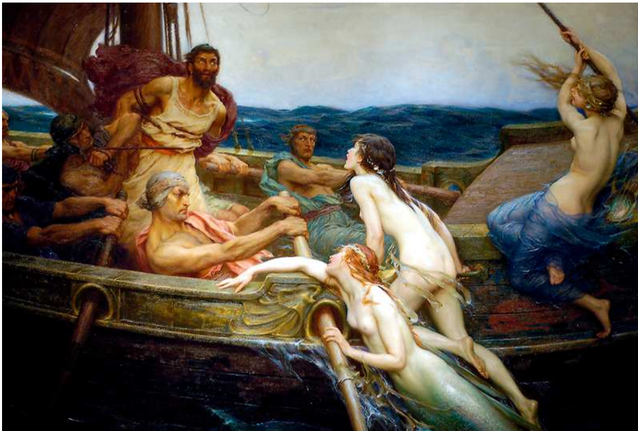
Herbert Draper (1909) Ulysses and the Sirens