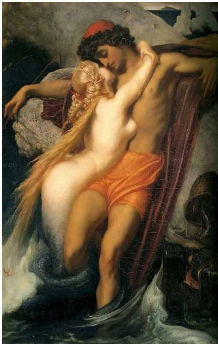
Lord Frederick Leighton (1858) The Fisherman and the Siren