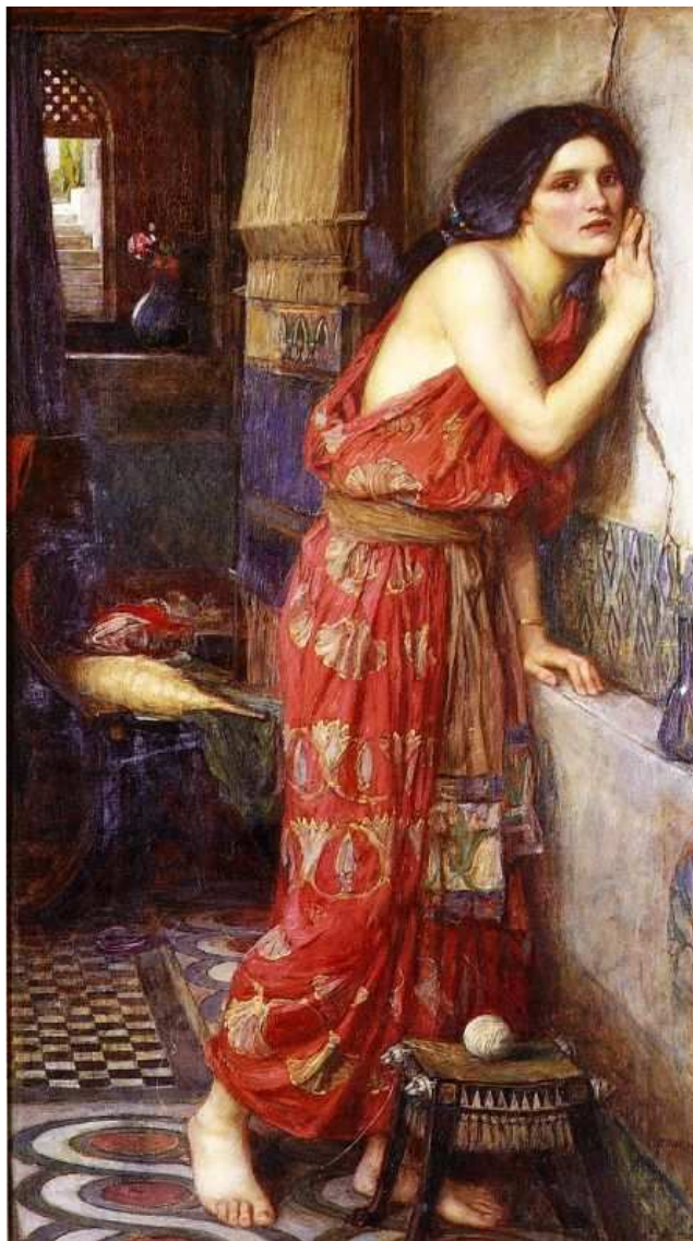
John William Waterhouse (1909) Thisbe