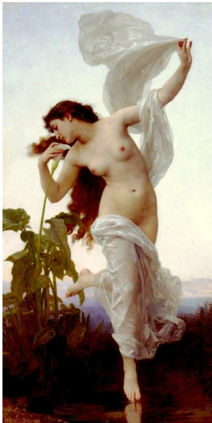
W.A. Bouguereau (1881) Dawn